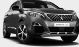
Platinum Grey رمادي بلاتيني