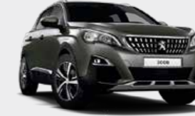
Amazonite Grey رمادي أمازونيت