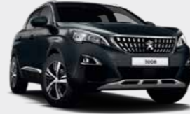
Hurricane Grey رمادي هريكين

* Colours might differ slightly from the pictures shown. * ربما تتغير بعض الألوان قليلاً مقارنة باللون الظاهر في الصورة.