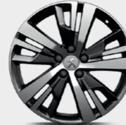
18" 'DETROIT' Two-tone diamond-cut alloy wheels (standard on Allure versions)

'DETROIT' بوصة 18 إطارات ألمنيوم بلونين بقصة ماسية (قياسي على طراز Allure)