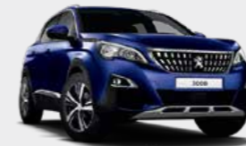
Magnetic Blue أزرق ماجنيتيك