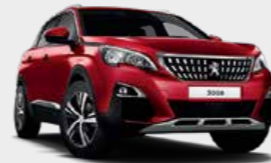
Ultimate Red أحمر قاتم