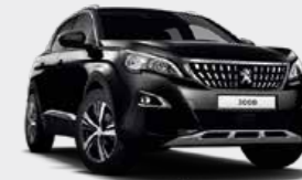
Perla Nera Black أسود نيرا لؤلؤي