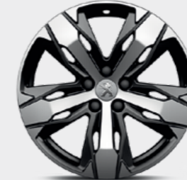
18" 'LOS ANGELES' Two-tone diamond-cut alloy wheels (Standard on GT Line)

'DETROIT' بوصة 18 إطارات ألمنيوم بلونين بقصة ماسية (قياسي على طراز Allure)