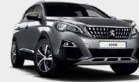
Artense Grey رمادي لامع