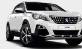
Bianca White أبيض بيانكا