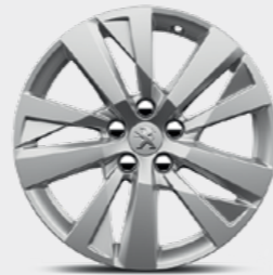
17" 'CHICAGO' alloy (standard on Active versions) 'CHICAGO' بوصة 17 (قياسي على طراز Active)

تم تصميمها لتلائم التصميم الخارجي الجريء، حيث تأتي بيجو 3008 مع خيار إطارات الألمنيوم، إما مطلية أو بلونين بقصة ماسية.