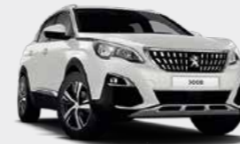
Pearlescent White أبيض لؤلؤي