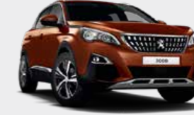
Metallic Copper نحاسي